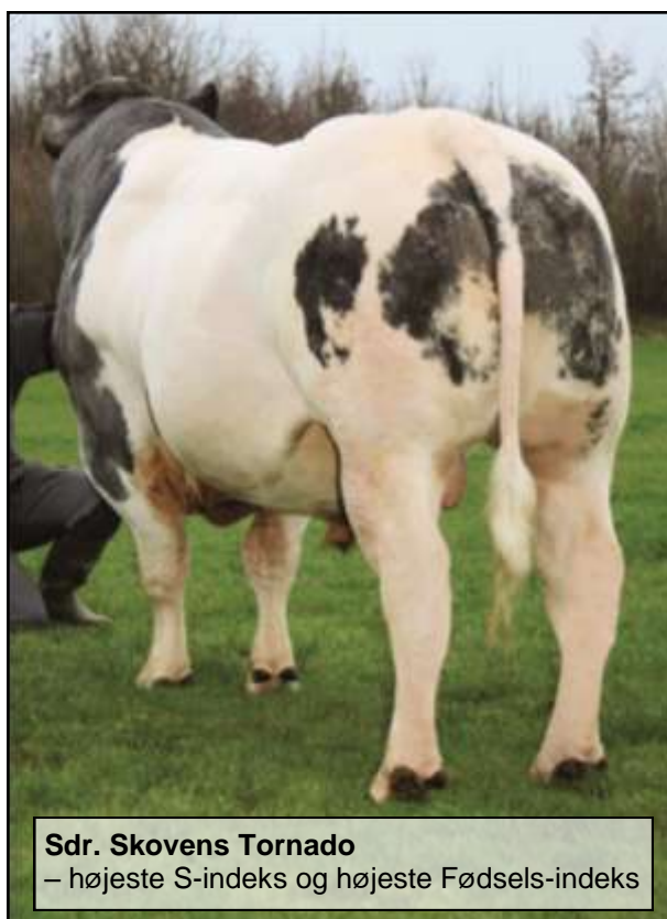
Sdr. Skovens Tornado – højeste S-indeks og højeste Fødsels-indeks