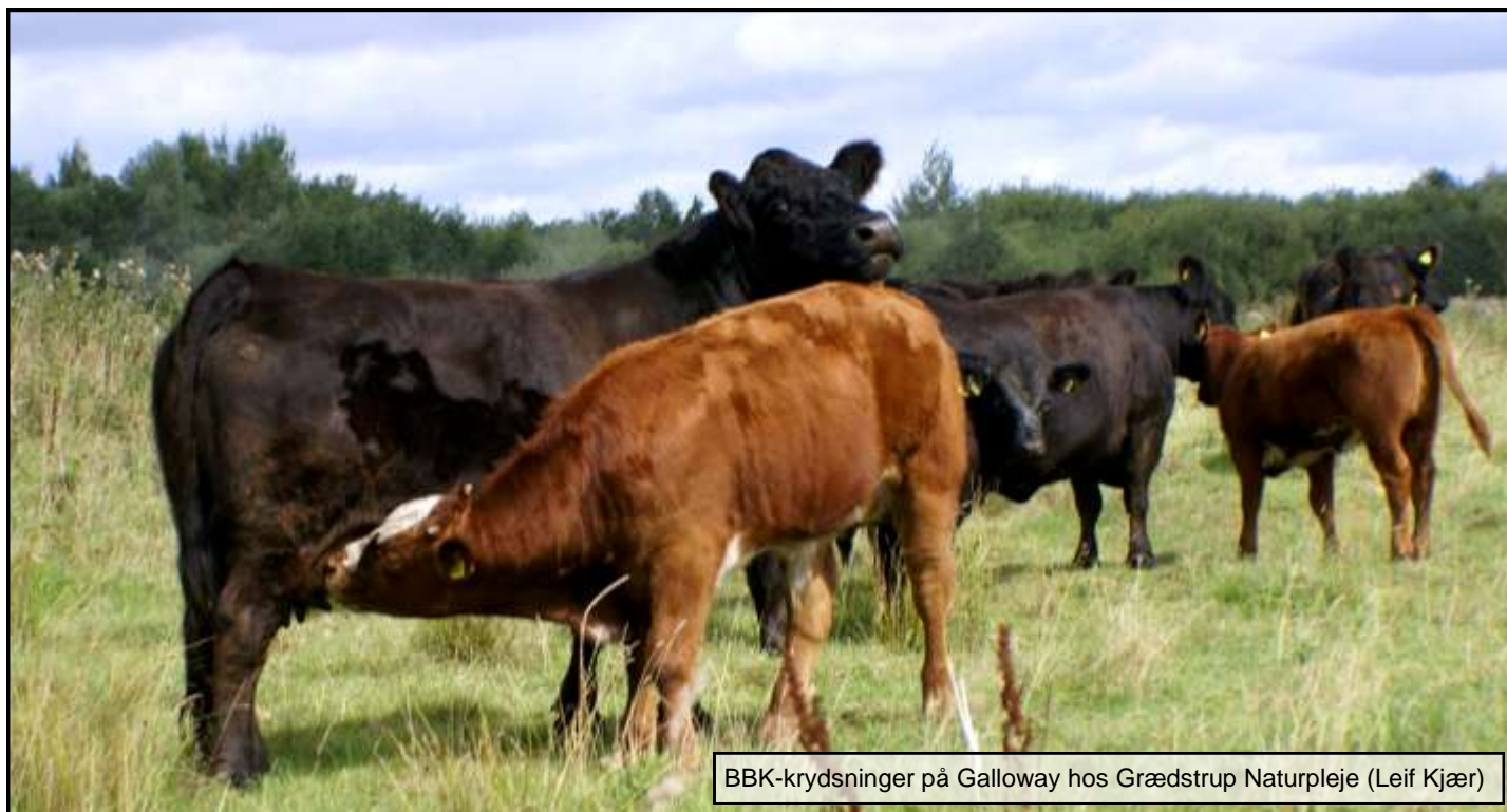
BBK-krydsninger på Galloway hos Grædstrup Naturpleje (Leif Kjær)

Kommer du i ”problemer”, så ring 2171 7750 eller 2947 4737