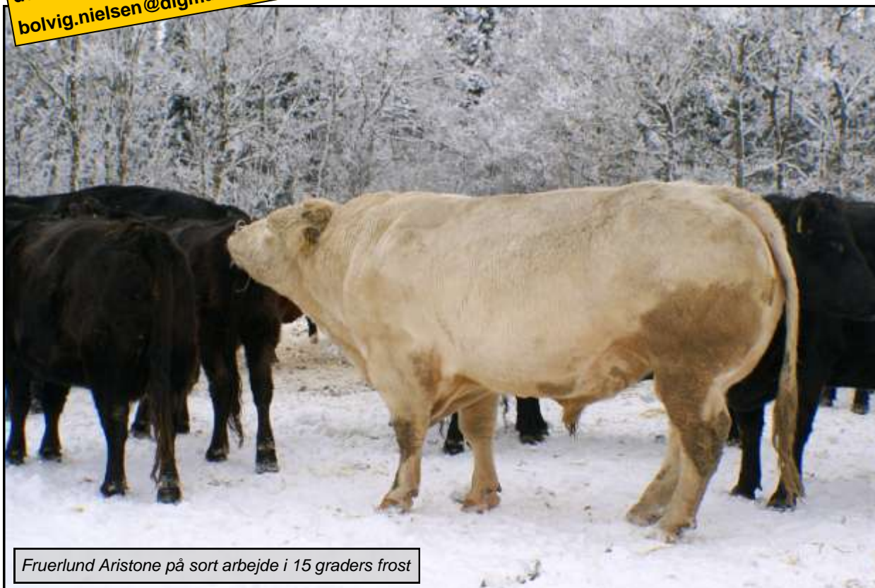
Fruerlund Aristone på sort arbejde i 15 graders frost