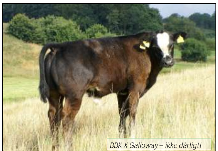
BBK X Galloway – ikke dårligt!