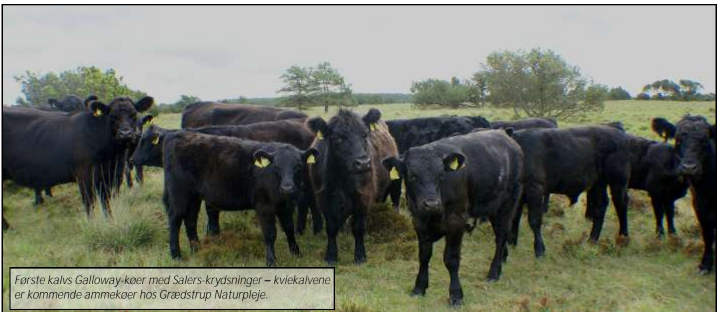
Første kalvs Galloway-køer med Salers-krydsninger – kviekalvene er kommende ammekøer hos Grædstrup Naturpleje.

I løber af formiddagen besøger vi flere folde. De er næsten alle gemt væk fra alfarvej. Det vil sige, at dyrene stort set kun ser mennesker, når der cirka hver anden dag er tilsyn med dem. Men man kan kun blive imponeret, for lige så snart man forlader firehjulstrækkeren, kommer alle de rolige og tillidsfulde dyr helt hen til én! Og det til trods for, at køerne er indkøbte og kommer fra forskellige besætninger.