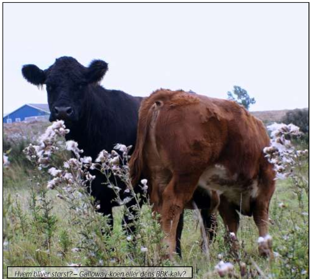
Hvem bliver størst? – Galloway-koen eller dens BBK-kalv?