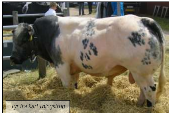
Tyr fra Karl Thingstrup