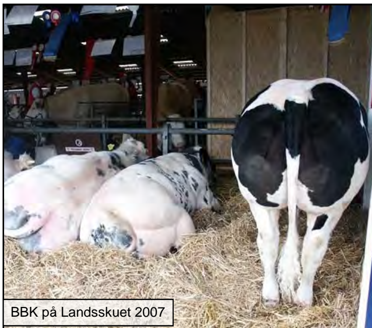
BBK på Landsskuet 2007